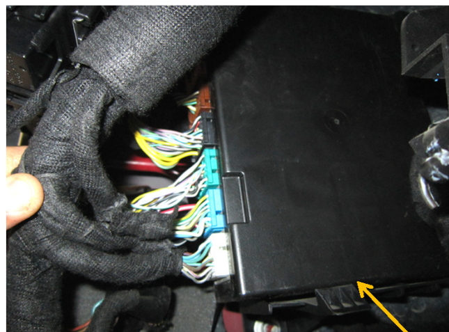
Central elétrica acima do puxador de capô.

Sempre verifique os sinais gerados nos fios indicados com auxílio de um multímetro ou uma caneta de polaridade, a KOSTAL não se responsabiliza por danos ocorridos durante a instalação tendo em vista que as montadoras podem mudar as cores e posicionamento dos fios sem aviso prévio. Em Caso de dúvidas favor entrarem em contato com o nosso SAC 0800 456 7825 ou (011) 2139-6165, WhatsApp(11)99191-6445 ou também pelo e-mail sac@kostal.com.