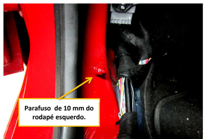
Parafuso de 10 mm do rodapé esquerdo.

Sempre verifique os sinais gerados nos fios indicados com auxílio de um multímetro ou uma caneta de polaridade, a KOSTAL não se responsabiliza por danos ocorridos durante a instalação tendo em vista que as montadoras podem mudar as cores e posicionamento dos fios sem aviso prévio. Em Caso de dúvidas favor entrem em contato com o nosso SAC 0800 456 7825 ou (011) 2139-6165, WhatsApp (11)99191-6445 ou também pelo e-mail sac@kostal.com .