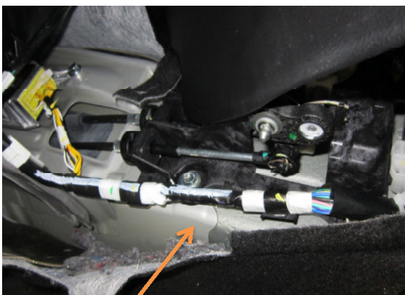
Chicote principal próximo do câmbio.