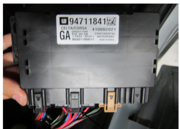
Conector de 12 vias.