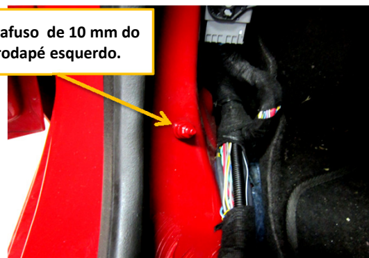
Parafuso de 10 mm do rodapé esquerdo.