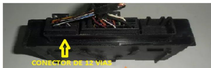
CONECTOR DE 12 VIAS