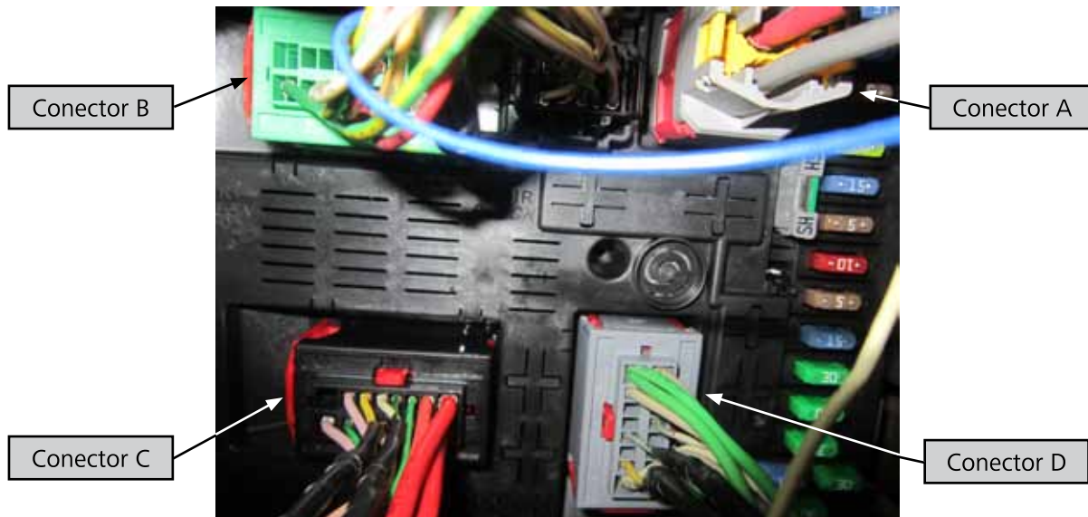
IMAGEM DOS CONECTORES NA CENTRAL ELÉTRICA.

Modelo do veículo: Peugeot 307 Montadora: Peugeot