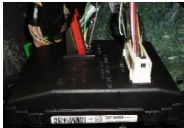
Central original localizada acima do puxador de capô

Sempre verifique os sinais gerados nos fios indicados com auxílio de um multímetro ou uma caneta de polaridade, a KOSTAL não se responsabiliza por danos ocorridos durante a instalação tendo em vista que as montadoras podem mudar as cores e posicionamento dos fios sem aviso prévio. Em Caso de dúvidas favor entrarem em contato com o nosso SAC 0800 456 7825 ou (011) 2139-6165 ou também pelo e-mail sac@kostal.com .