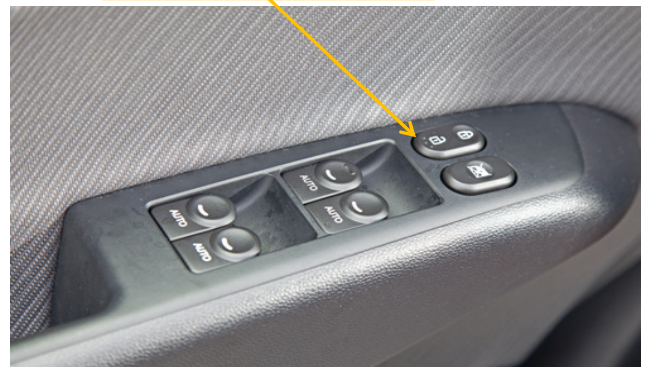
Botão trava/destrava na porta do motorista.

Sempre verifique os sinais gerados nos fios indicados com auxílio de um multímetro ou uma caneta de polaridade, a KOSTAL não se responsabiliza por danos ocorridos durante a instalação tendo em vista que as montadoras podem mudar as cores e posicionamento dos fios sem aviso prévio. Em Caso de dúvidas favor entrarem em contato com o nosso SAC 0800 456 7825 ou (011) 2139-6307 ou também pelo e-mail sac@kostal.com .