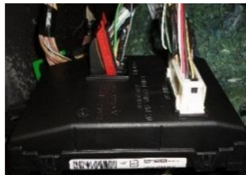
Central original localizada acima do puxador de capô

Sempre verifique os sinais gerados nos fios indicados com auxílio de um multímetro ou uma caneta de polaridade, a KOSTAL não se responsabiliza por danos ocorridos durante a instalação tendo em vista que as montadoras podem mudar as cores e posicionamento dos fios sem aviso prévio. Em Caso de dúvidas favor entrarem em contato com o nosso SAC 0800 456 7825 ou (011) 2139-6165 ou também pelo e-mail sac@kostal.com .