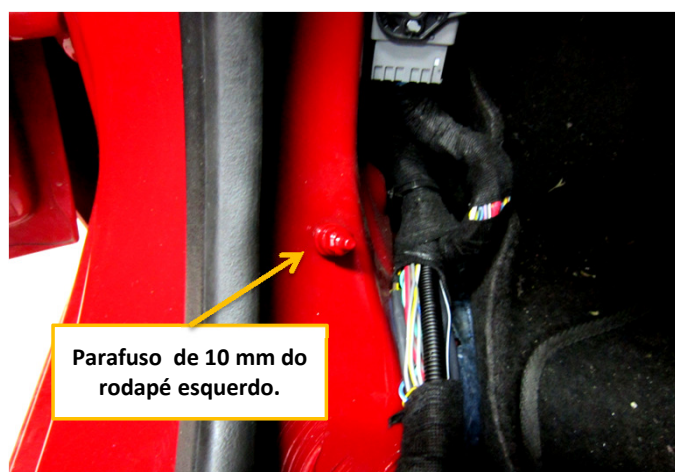
Parafuso de 10 mm do rodapé esquerdo.

Sempre verifique os sinais gerados nos fios indicados com auxílio de um multímetro ou uma caneta de polaridade, a KOSTAL não se responsabiliza por danos ocorridos durante a instalação tendo em vista que as montadoras podem mudar as cores e posicionamento dos fios sem aviso prévio. Em Caso de dúvidas favor entrarem em contato com o nosso SAC 0800 456 7825 ou (011) 2139-6165, WhatsApp(11)99191-6445 ou também pelo e-mail sac@kostal.com.