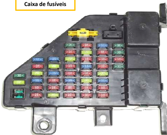
Caixa de fusíveis